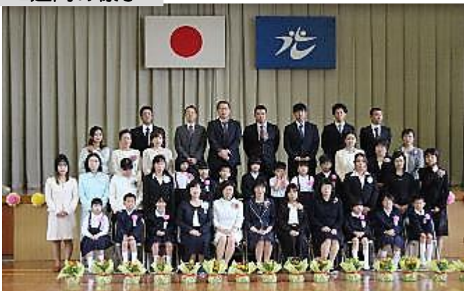
入学式後の記念撮影の様子です。きっと4月からひとまわり成長した姿、表情で写っていることでしょう