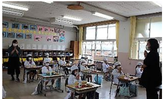
初めての給食をいただきました。食べ方だけでなく、給食前の手洗い、給食後の歯磨きの仕方もしっかり学びました。

新登校班での登校の様子はいかがでしょうか？1年生は、園までの送迎から登校班での徒歩による登校となりました。通学路での安全のために気をつけていくことはたくさんあります。登下校で人通りのない場所(区間)でひとりになるようなことはありませんか？お子様の登下校の様子を、ご家庭でぜひ聞いてみてください。何か気になる状況等がありましたら、学校までお知らせください。登校班の班長や班員のみんなは、1年生の歩く速さに合わせるようがんばっています。1年生も遅れないようにがんばっています。慣れてきたら、きっとあいさつも今以上に元気にできるようになると期待しています。(校長)