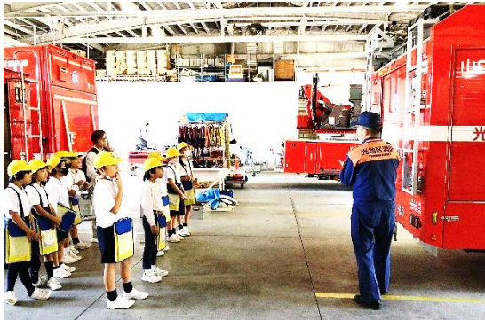
【4年生 山口市方面 山口県庁】

10月10日(火)から後期が始まりました。後期は、社会見学や修学旅行と校外での学習がありました。学校で学んだことをもとに現地へ行って確かめ、新たな発見をして学びを深めるよい機会です。また、周防小学校と合同での実施は、新しい仲間づくりの機会でもあります。多くの体験が個々の成長につながることを期待しています。