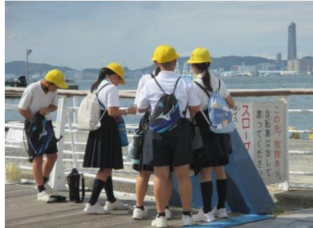
【6年生 北九州市・美祿市方面 門司港・いのちの旅博物館】