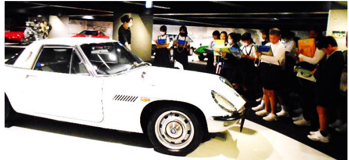
【5年生 広島方面 MAZDA ミュージアム】