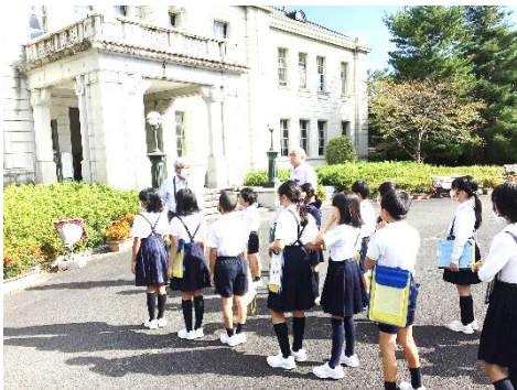
【3年生 光市内 光消防署】