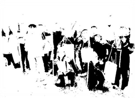
3年生は山の頂上から上島田を一望、まちの歴史も学びました