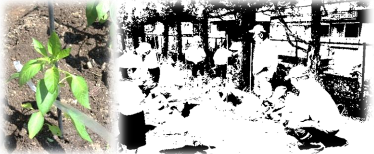
いつごろ収穫できるかな？楽しみです

2年生の畑にミニトマト・キュウリ・ピーマンの苗が植えられました。地域の方がこの日の為に、事前に畑を耕し、準備してくださいました。子ども達からの質問にも何でも答えてくださるので、畑の先生を前に子ども達の目が尊敬の眼差しでキラキラと輝いていました。大切に収穫まで育てていきたいと思います。