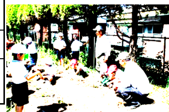
野菜作り (2年) 5.19