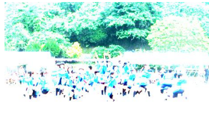
〈エイサーメドレー2016〉(5・6年)

前日準備から、当日の競技へのご参加とご声援、またお手伝いや片付けまで、多面にわたってPTA役員の皆様をはじめ、多くの方々にご協力をいただきました。本当にありがとうございました。