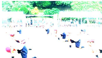
〈上小A・R・A・S・H・I〉(3・4年)