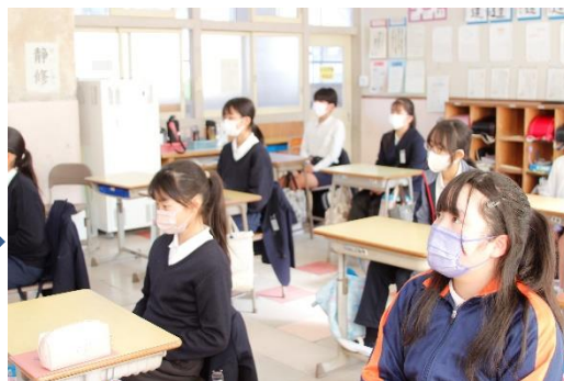
放送を教室で落ち着いて聞きました。