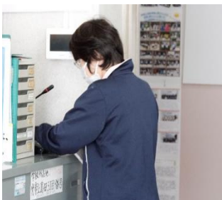
全校に放送で指示をしました。

「…今日の訓練は、不審者が学校に侵入してきた時に、誰一人けがをすることなく無事に避難ができるようにするための訓練でした。…(途中略)…地震が起きたときは、揺れが収まったらとにかく建物の外の安全なところや決まった避難場所へと逃げます。火が発生したら、火に近寄らず火元から遠いところを歩いて外に避難します。どちらも逃げる道がすぐに決まります。でも、不審者が侵入したときは違います。不審者は「人」です。人は動くので、その動きによって危険な場所が変わるのです。慌てて避難をして、かえって危険なところに近づく恐れがあります。だから、いったん待機して、避難の方法を放送や電話等で伝えていきます。普段から「放送が流れたら、手を止めて黙ってきく」ことを身につけておかなければいけません。…」このような話をしました。現在、業間休みや昼休みに全校一斉の「換気タイム」を設けています。その放送の時にも、立ち止まってしっかり聞く児童の姿が見られています。素晴らしいと思います。毎日同じ内容を放送する場合でも、「放送は手を止めて聞く」を身につけておくことで、大切なことの聞き逃しを防ぐことができます。このような素直な子どもの姿から、これからも大切なことを伝え続けていきたいと身が引き締まる思いがしました。