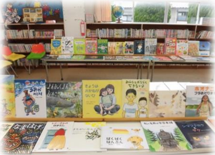
図書室の机にぎっしりと並ぶ本