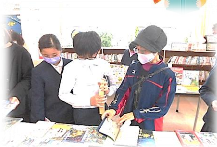
地域の方と読み方についての会話

県立図書館から230冊ほど新刊図書を借りてきて「選書会」を実施しました。子どもたちは、購入希望の本を一人3冊選んで、しおりを挟みました。選び終わると、自分が選んだ本を友だちに紹介したり、しおりがたくさん挟んである本の内容を確認めたりする姿が見られました。ご来校いただいた地域の方にも選書会の様子を見ていただく機会が持てました。また、家に帰ってから選んだ本のことを話題にするなど、家庭や地域でいつも以上に、本に興味を持つことができる期間となりました。